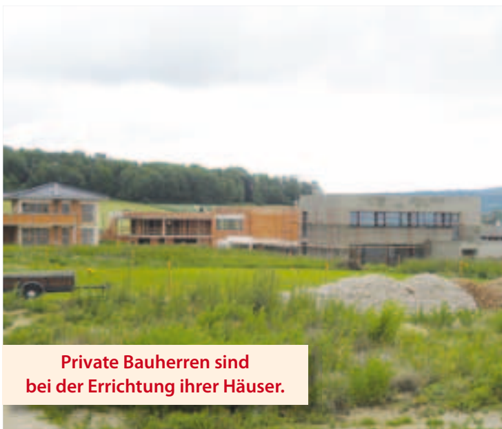
Private Bauherren sind bei der Errichtung ihrer Häuser.

Die Gemeinde Pasching hat in den vergangenen Jahren Grundstücke in Thurnharting an Bauträger und Private verkauft.