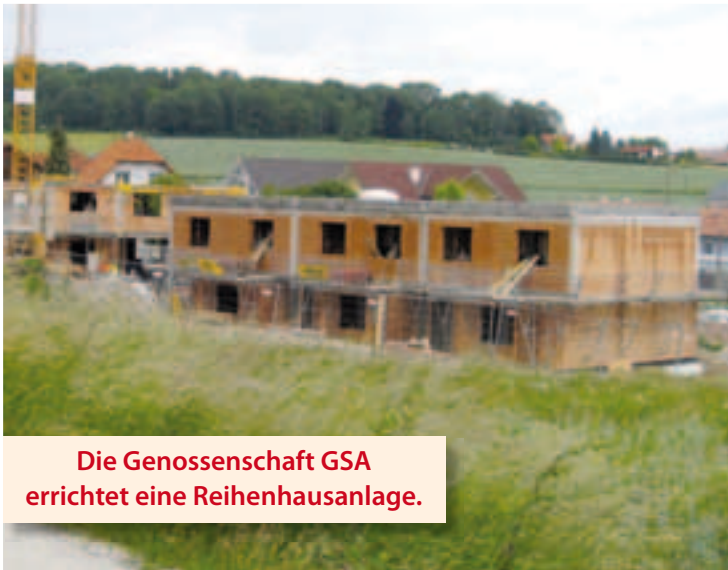
Die Genossenschaft GSA errichtet eine Reihenanlage.