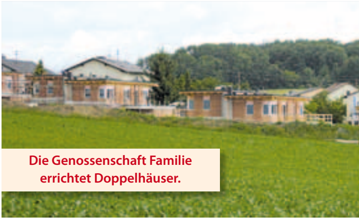
Die Genossenschaft Familie errichtet Doppelhäuser.