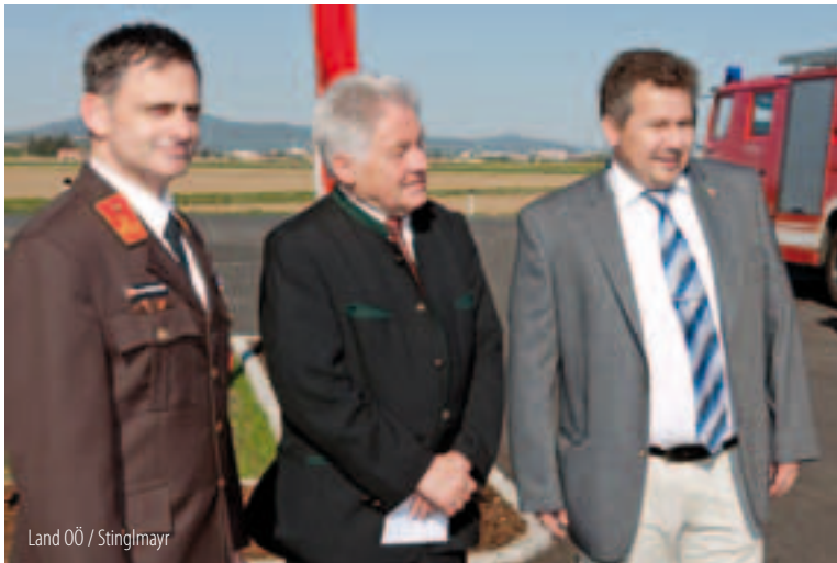
Land OÖ / Stinglmayr