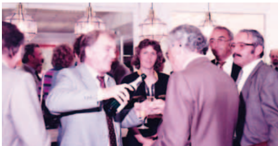
Feier der Apothekeneröffnung 1982

Feiern Sie mit uns das 30-jährige-Jubiläum der Christophorus-Apotheke (dem TIME-Gesundheitszentrum) in der PlusCity!