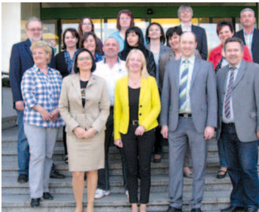
Der neue Bezirkshauptmann neben dem Bürgermeister unter den RathausmitarbeiterInnen.

B ei seinem Antrittsbesuch wurden die künftige Zusammenarbeit und aktuelle Themen besprochen. Bei einem Rundgang durch das Rathaus konnte sich der neue Bezirkshauptmann von den Örtlichkeiten ein Bild machen und lernte dabei auch die Mitarbeiter des Rathauses kennen. |