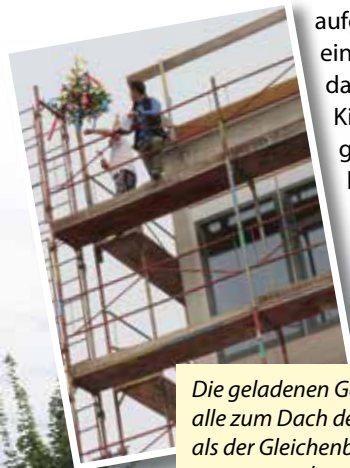
Die geladenen Gästen blickten alle zum Dach des Gebäudes als der Gleichenbaum gesetzt wurde.