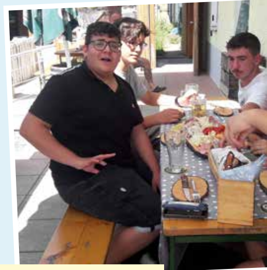
Stärkung beim Fahrradausflug

Am 10. Juli machten wir einen Radausflug nach Allhaming zum Gasthaus Gassner. Die Idee für diese Tour lag nahe: ist doch die Pächterin des Gasthauses die Mutter eines unserer Jugendlichen. Trotz der extremen Hitze an diesem Tag waren fünf Jugendliche mit von der Partie. Am Ziel angekommen, gab es eine Brettljause und erfrischende Getränke für alle. Danach kühlten wir unsere überhitzten Körper im Sippbach ab, um wieder fit für die Heimreise zu sein. Ein gelungener Ausflug – auch in sportlicher Hinsicht!