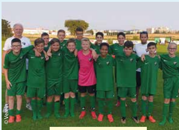
Unsere neue U14 Mannschaft

Nicht nur, dass man sich mit dem Beziehen des eigenen Sportplatzes auf der Zielgeraden befindet, so dürfen wir weiters verkünden, dass auch unser Nachwuchsbereich wieder um eine Mannschaft gewachsen ist.