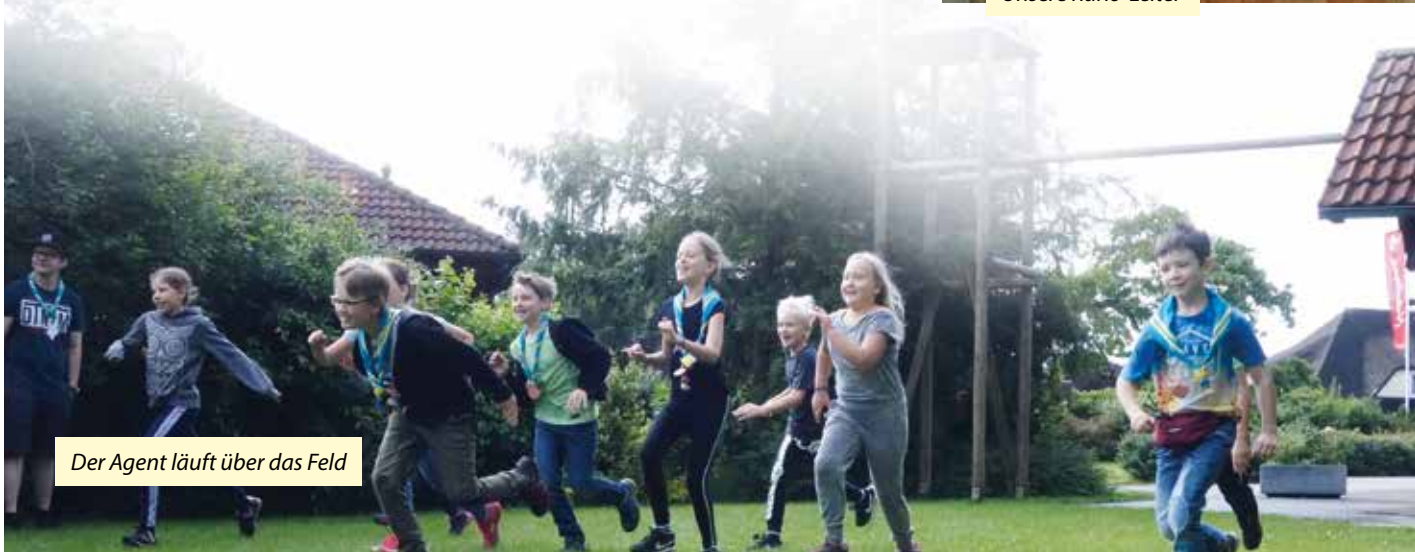
Der Agent läuft über das Feld