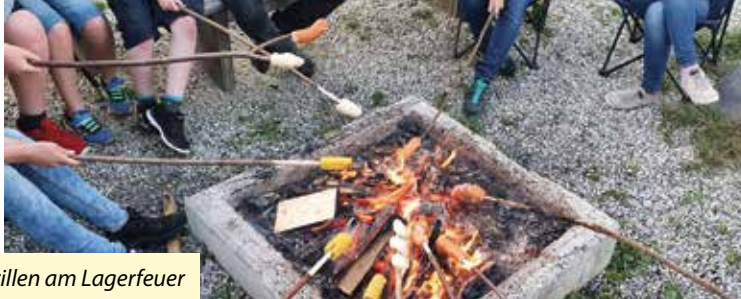
Grillen am Lagerfeuer