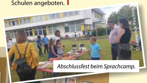
Abschlussfest beim Sprachcamp.

Kühles Eis für heiße Köpfe. Auch heuer sollte Paschings Sommer Sprachcamp den Schülern den Wiedereintritt ins neue Schuljahr erleichtern.