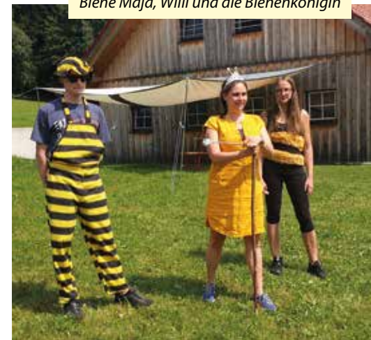
Biene Maja, Willi und die Bienenkönigin

Das für die Pfadfinder typische Lagerfeuer gab es selbstverständlich auch. Dabei wurden Gruppen gebildet, um die verschiedenen Aufgaben bewältigen zu können, wobei jeder nur sein eigenes Werkzeug benutzte. Die einen kümmerten sich um das Holzhacken, eine andere Gruppe um die Spreißel und ein Team um das Feuer selbst. Aber ganz besonders freuten sich die Kinder auf das Sommerlager, welches auch dieses Jahr stattfand. In Odelboding wurden die Zelte und Kochstellen aufgebaut und fast eine ganze Woche dort geschlafen und gekocht. Das Thema der Woche war „Biene Maja“, welche die Kids gemeinsam mit Willi, Cassandra und der Bienenkönigin besuchte. Sie stellten den Kindern verschiedene Aufgaben, welche es zu bewältigen galt. An einem Tag kam sogar ein Imker zu Besuch und erzählte allen Anwesenden, wie Bienen leben und was Bienen so besonders macht. Zum Schluss zeigte er uns noch einen geöffneten Bienenstock und ließ uns anschließend verschiedene Honigsorten verkosten. Die Covid-Zeit war für uns Pfadfinder auf jeden Fall nicht so langweilig wie man es vermuten möchte, denn wir erlebten verschiedene Abenteuer, wenn auch mit ein bisschen mehr Abstand.