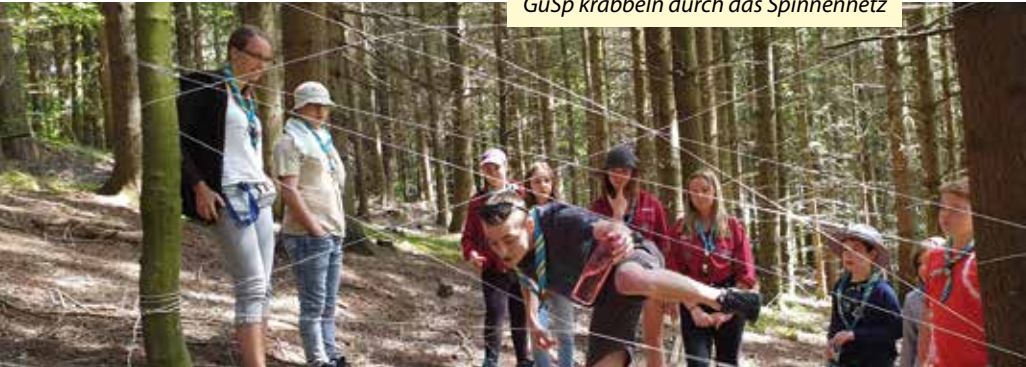
GuSp krabbeln durch das Spinnennetz

Die Zeit des Lockdowns und auch die Zeit danach waren für uns Pfadfinder eine große Herausforderung. Doch mit Kreativität, Spontanität und Motivation haben wir auch diese angenommen und in den verschiedenen Stufen eine aufregende Zeit erlebt.