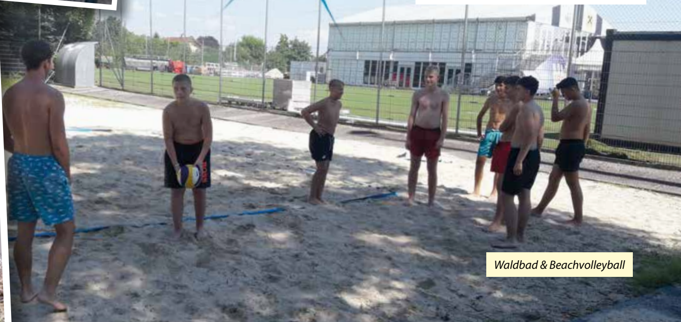
Waldbad & Beachvolleyball